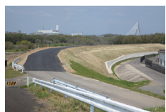
▲矢作川岩津上流築堤工事

川や道路、橋や下水道、農地整備などの公共工事を行い、技術と知識を元に強く安全な地域社会づくりに貢献しています。