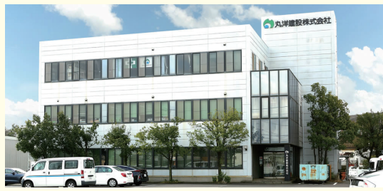
丸洋建設株式会社本社

私たちの会社は、過去に大きな被害をもたらした伊勢湾台風後の土木需要の中で生まれた、創業から66年を迎える建設会社です。私たちの仕事は総合建設業といえます。学校や公民館などのみんなが使う建物や、道路や橋などの生活の基盤をつくりたり(公共工事)、工場や事務所など会社の建物を新しく建てたり(民間工事)、古くなった部分を直したりします。また、個人の方からの要望に応じて設計をして新しい家を建てたり、リフォームをしたり(住宅工事)、ほかに、土地を探したり空き地をきれいにして、工場や事務所、住宅を建てるための土地にする(不動産事業)など、さまざまな事業を行っています。