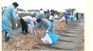
▲矢作川クリーン大作戦

私たちはさまざまな「SDGs」に取り組んでいます。ジェンダーレスをめざした男女平等な雇用環境の整備や、従業員一人一人が能力を最大限に生かすことができ、ストレスフリーな風通しの良い職場づくりをめざした職場環境の整備のほか、地元中学生からの職場体験者受け入れ、地元への寄付活動、公共工事を通じた社会資本整備活動といった、地域とのつながりを大切に交流活動や、快適な環境づくりをめざした社会貢献活動なども行っています。