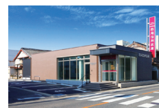
▲西尾信用金庫相談プラザ

公共施設や厚生施設、集合住宅、スポーツ施設などあらゆる建築物、リノベーションや修繕・改修工事、増築、耐震補強工事も施工しています。