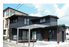
▲建設した住宅(Aさま邸)

住宅は「人間が人間らしい幸せな生活を営むために必要な生活環境を実現する」もの。毎日の生活の基盤となる住まいを長く住みやすい場所になるように形にします。